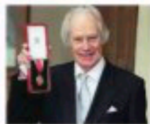
La leggenda. Sir George Martin

LONDRA. È morto nella sua casa londinese George Martin, figura talmente importante per la band da essere noto come il quinto Beatle. A PAGINA 48-49