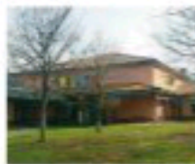
Nel verde. L'asilo Fesari

RODENGO. Situazione delicata per la scuola materna dopo la sentenza della Cassazione che ha ribattuto precedenti pronunce. A PAGINA 25