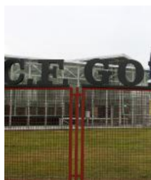
La DTR (già C.F. Gomma)

A Gardone Valrompia va registrato l'accordo tra direzione della Beretta , Rsu, Fim, Fiom e Uilm per il ricorso alla Cig per far fronte a una riduzione degli ordini: prevede anticipi e rotazione compatibilmente con le esigenze tecnico-produttive e organizzative. Saranno interessati 479 dei 820 dipendenti per 8 settimane dal 29 febbraio; dal 26 aprile la piena ripresa dell'attività. Nell'ambito della «partita» connessa ai 65